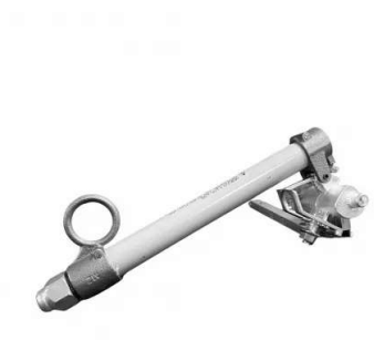
CARTUCHO PORTA FUSIVEL 15kV 100A 6,3KA MAURIZIO