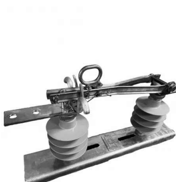
CHAVE SECCIONADORA DIST. 15KV 400A 16KA POLIM. - MAURIZIO

R$ 122,40 à vista com desconto Pix - Mercado Pago ou 6x de R$ 20,82 Sem juros Cartão de Crédito - Mercado Pago